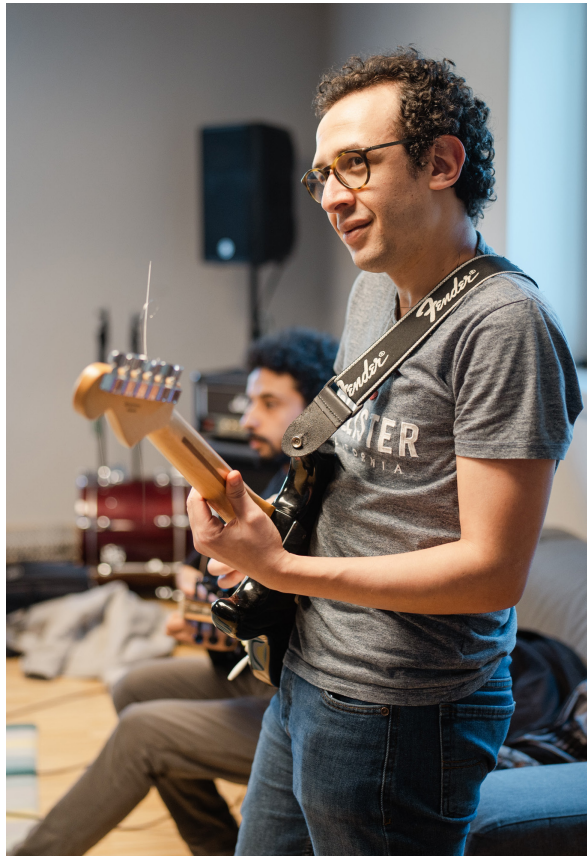
Sonotron rehearsal rooms

Grâce à sa localisation au sein du 1535° Creative Hub, le Sonotron se trouve au centre d'un