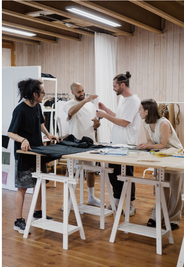
No One's fashion for future studio