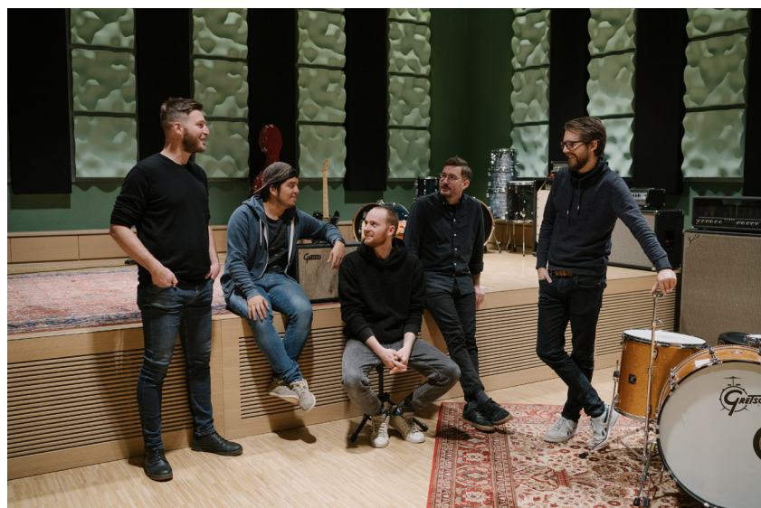
Unison Studios sound and recording studio