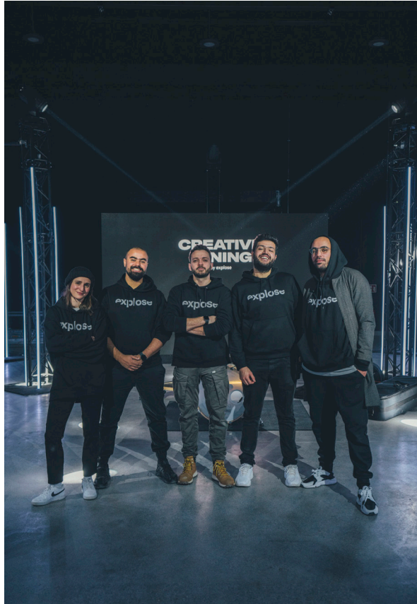
Explose digital agency